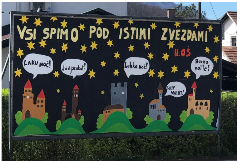
Plakat II. OŠ Celje za Galerijo ob Savinji 2024

Ob občinskem prazniku sodelujemo s poslikavo plakatov.