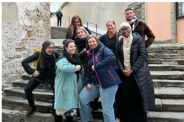
Učiteljji s Finske in Češke v Piranu

Napisali smo nov projekt KA-SCH122 (Učenje skozi ušesa, oči in želodec: Nova znanja - Nove izkušnje - Dvig samozavesti), ki je bil odobren.