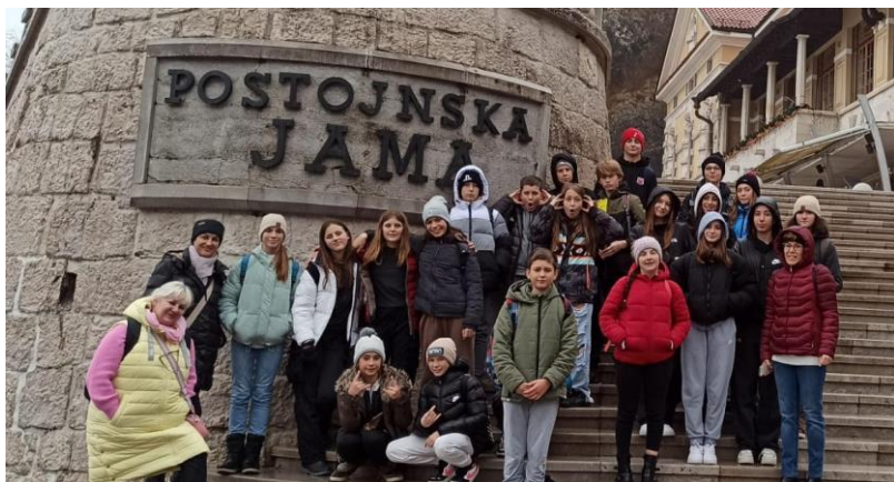
Naši učenci s češkimi vrstniki

V šolskem letu 2023/24 smo realizirali t. i. sledenje na delovnem mestu, kar pomeni, da smo v mesecu novembru gostili 6 učiteljev s Finske in 2 s Češke. Decembra pa smo izvedli skupinsko mobilnost učencev s Češke. K nam je prišlo 10 učencev. Spali so pri družinah naših učencev. V času obiska so v sklopu z naše strani pripravljenih delavnic za učence in učitelje začutili utrip naše šole in način dela v njej, izvedeli več o našem mestu; obiskali pa so tudi Ljubljano, Postojnsko jamo ter primorsko mesto Piran.