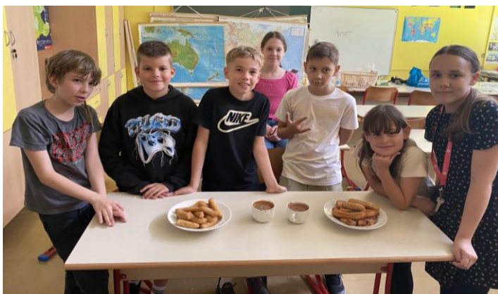
Španska sobotna šola

Učenci so se na sobotnih šolah na zanimiv in interaktiven način seznanili z različnimi temami, ki so jih izbrali glede na lasten interes.