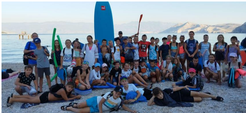
Naši petošolci v Baški (arhiv II. OŠ Celje)