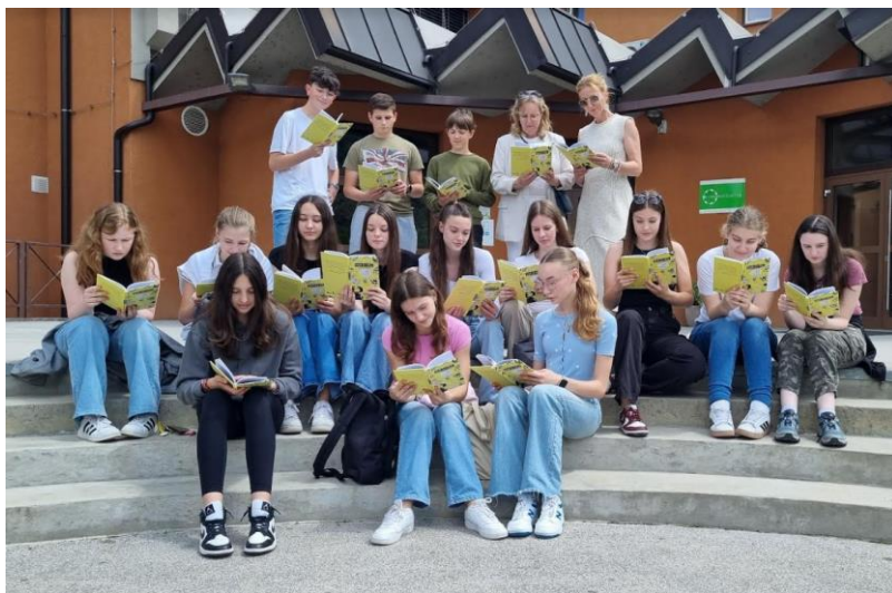
Zlati bralci 2023/24 v akciji

Na zaključku bralne značke razredne stopnje je nastopilo Škratovo lutkovno gledališče Celje s predstavo Alma, učenci predmetne stopnje pa so prisluhnili intervjuju z našim ravnateljem in pokramljali ob osvežilnih torticah.