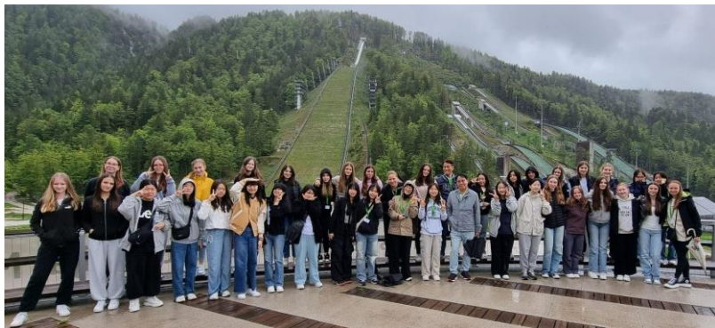
Naše učence z vrsticami iz J Koreje v Planici

tako pa smo tudi mi dobili nekaj vpogleda v njihovo kulturo. Kljub kulturnim razlikam, smo našli skupen jezik in ugotovili, da nas povezujejo prijaznost, srčnost, radovednost in glasba.